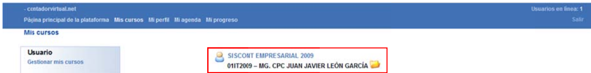
Figura N° 04: Herramientas de la Plataforma de Cursos