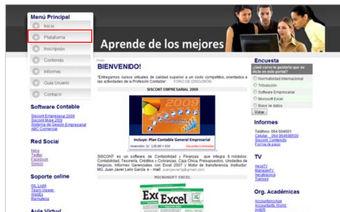
Figura N° 02: Acceso a la Plataforma de Cursos Empresariales